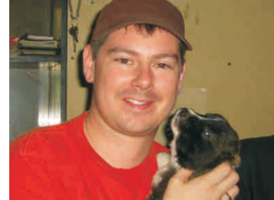
დევის ბროუჩი და ლეკვი