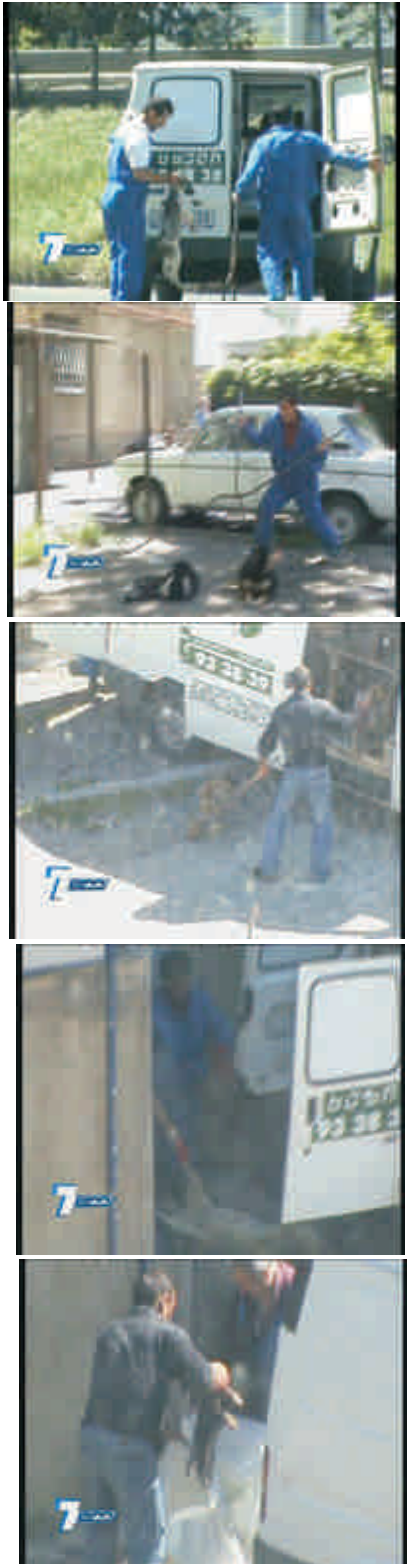
1-ლი ვეტ. კლინიკის თანამშრომელთა სისასტიკე ცხოველების მიმართ.

ცხოველთა დაცვის არასამთავრობო ორგანიზაციები: საქველმოქმედო ფონდი „არ გ უ ს ი“ „ცხოველთა უფლებების კომიტეტი“ „საქართველოს ცხოველთა დაცვისა და გადარჩენის საზოგადოება“