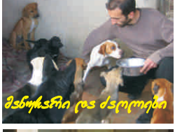
მანუასრი და ძაღვები