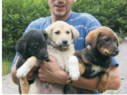
ლუკუები მიდიან ახალ მფლობელთან.

მხარში ამოუდექით „საქართველოს ცხოველთა დაცვისა და გადარჩენის საზოგადოება“-ს და თქვენ ამით დაიწყავთ ცხოველთა უფლებებს!