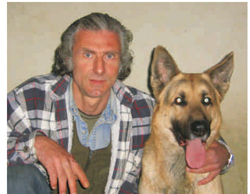
გაზეთში არსებული ყველა ფოტო გადაღებულია „საქართველოს ცხოველთა დაცვისა და გადარჩენის საზოგადოების“ წევრების მიერ